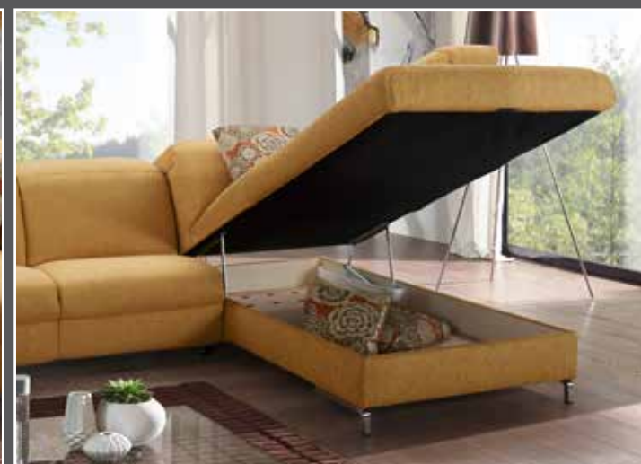
Variante 24 avec coffre