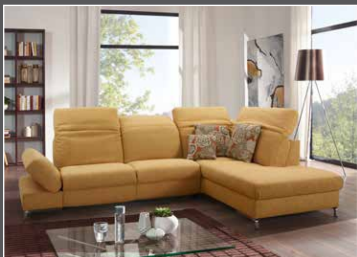
Composition 85 / 24 en 24 Q2 Uni mais