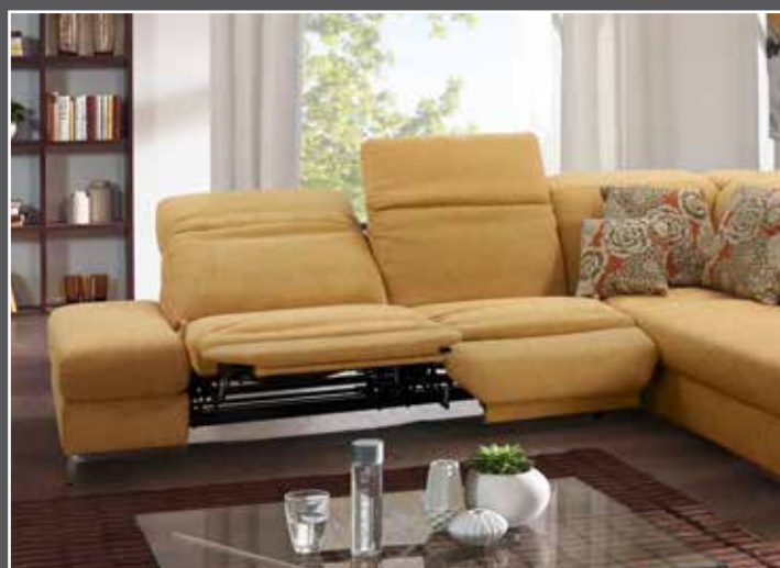
Variante 85 système près du mur