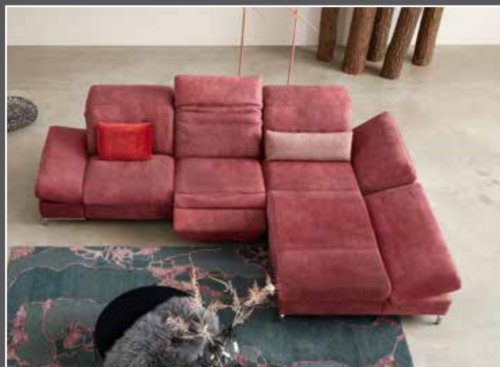
Variante 85 système près du mur