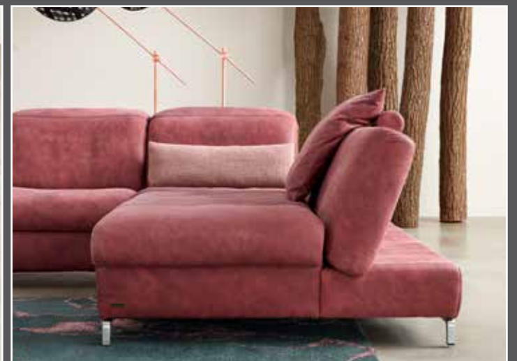
Coussin dos 95Y